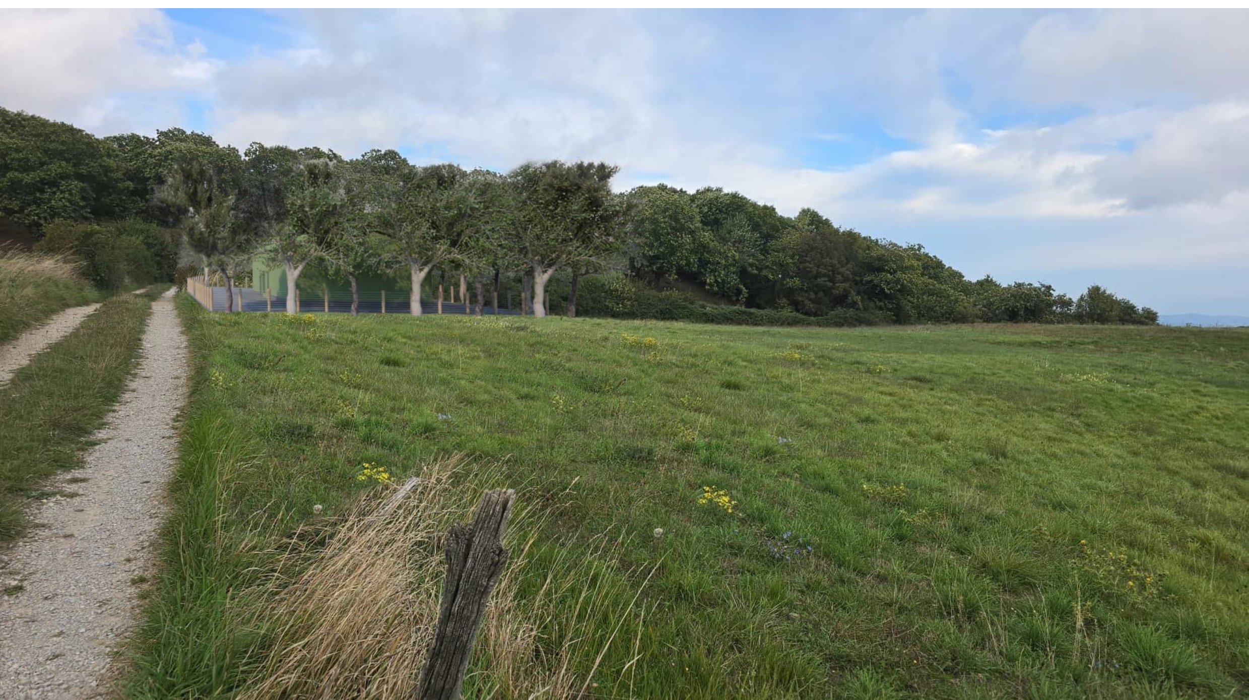
Vista da Est- vista con piante per mitigazione cresciute (età matura).