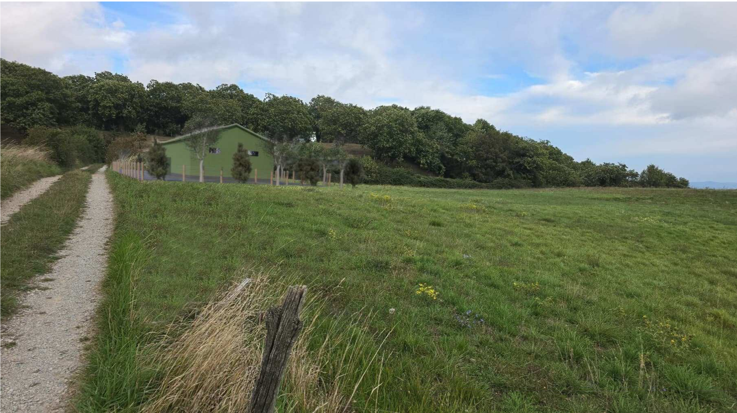
Vista da Est - Vista con piante per mitigazione basse, piantate a fine costruzione.