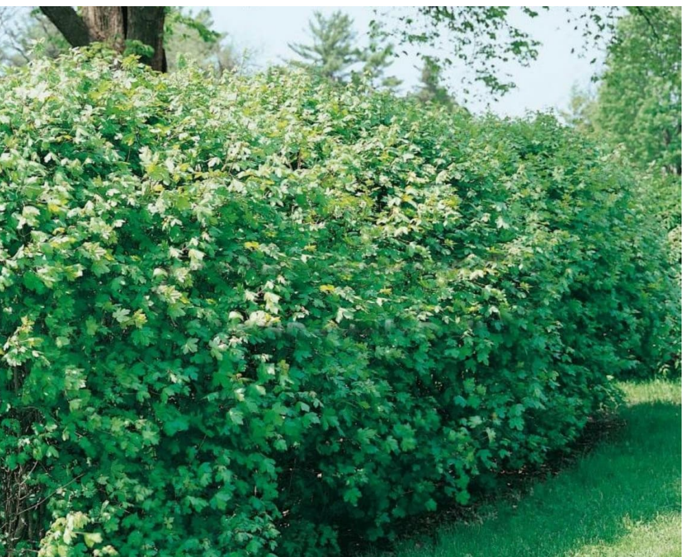
Acer campestre (Acer trilobo)