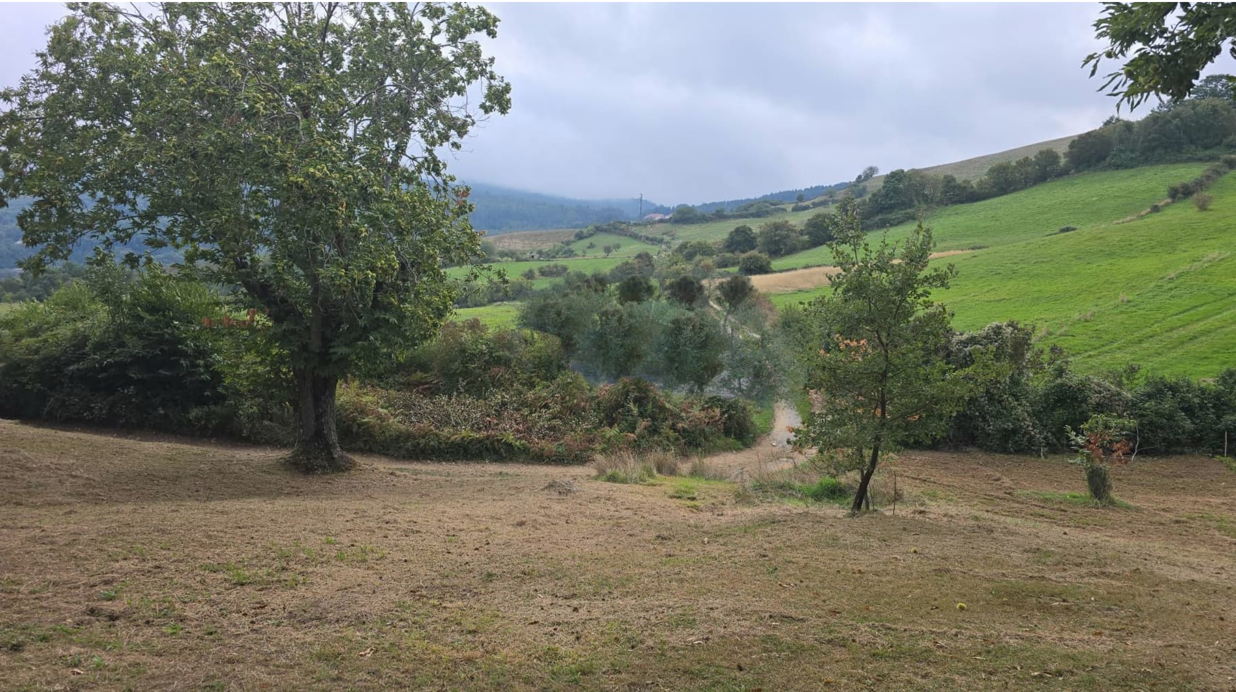
Vista percorrendo la strada da Ovest (dalla collina) Vista con piante per mitigazione cresciute (età matura).