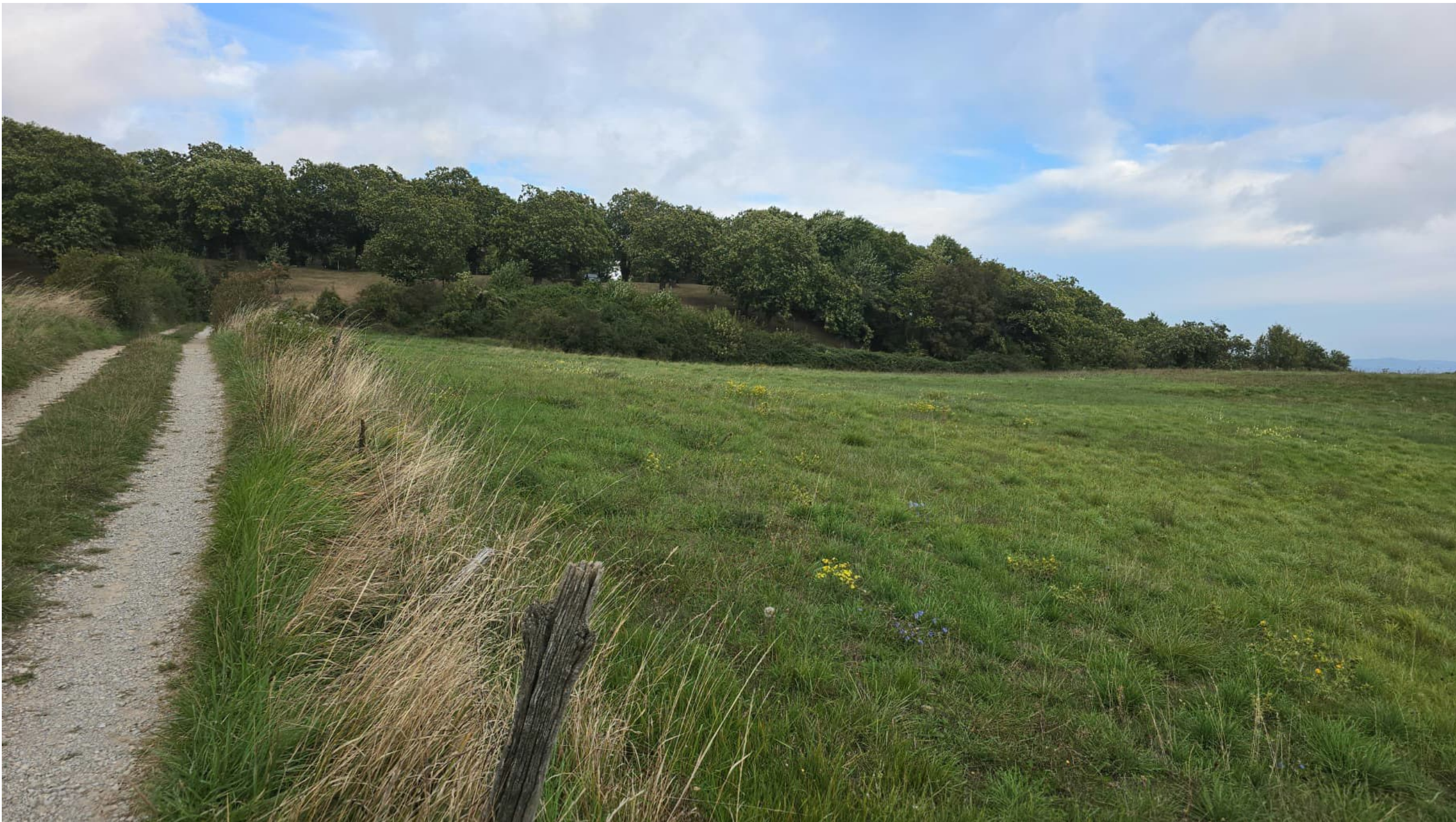
Vista da Est