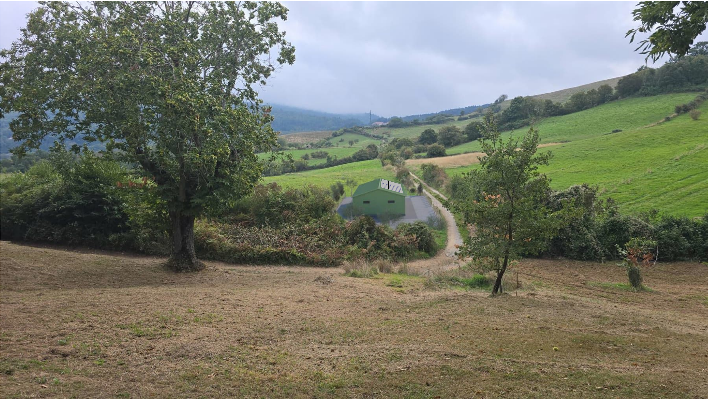
Vista percorrendo la strada da Ovest (dalla collina) Vista con piante per mitigazione basse, piantate a fine costruzione.