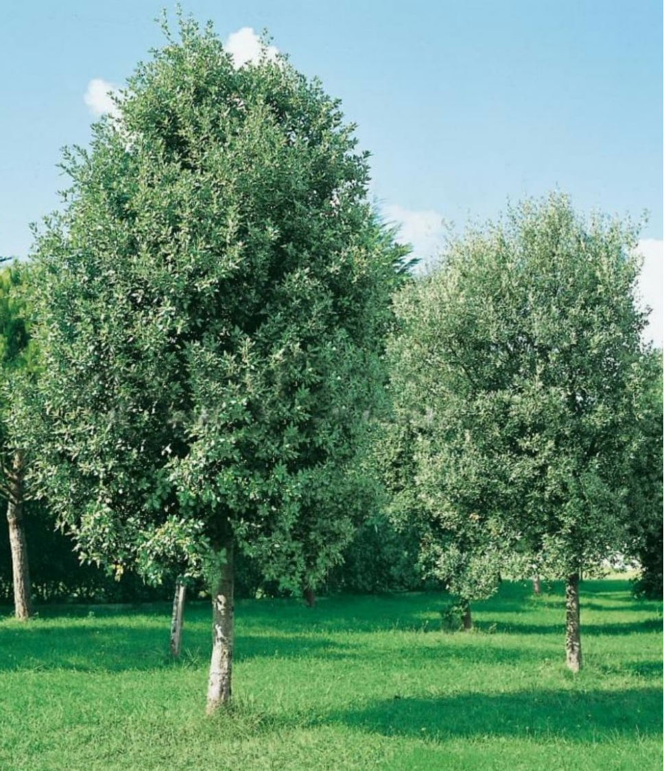
Quercus ilex (Leccio)