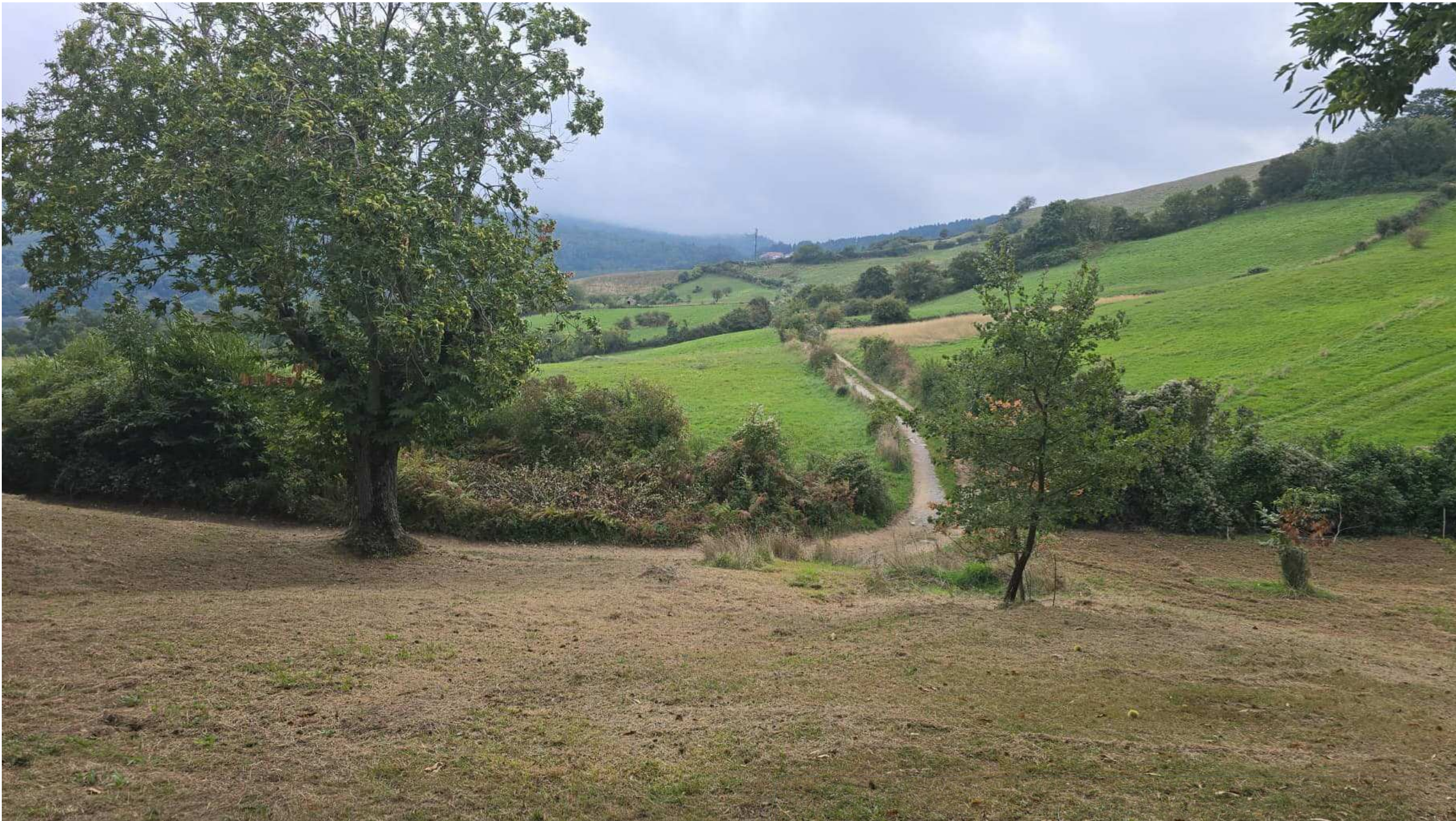
Vista da Ovest